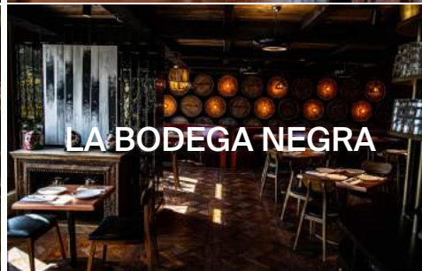
LA BODEGA NEGRA